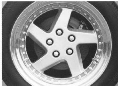
Haftpflcht: Superbreitreifen auf 17" Zoll-Leichtmetallfelgen.