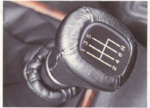
Neue Gangart: Vorwärts mit Sechs.

Der Lotus Omega fällt auf. Als eine aussergewöhnlich faszinierende Verbindung von Höchstleistung und Exklusivität. Brillant in Form, perfekt im Styling demonstriert der Lotus Omega auf der ganzen Linie eine kompromisslose Kompetenz, die nur eine Bezeichnung verdient: meisterhaft.